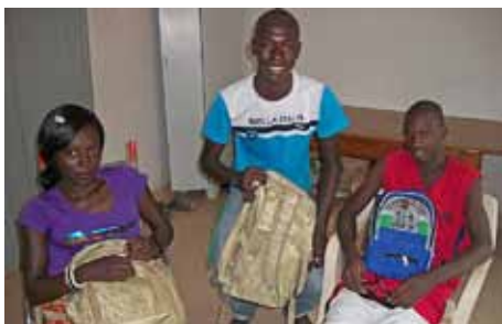
Fin 2011, distribution de fournitures scolaires

Pour tous renseignements complémentaires n'hésitez pas à nous contacter