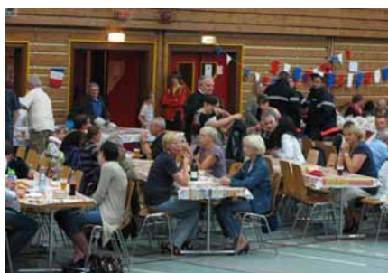
Fête nationale à Kembs