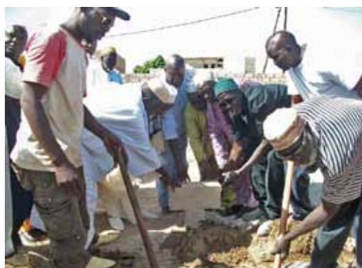
Pose de la première pierre du CARFEAH en présence des membres d'ALVM-Sénégal et des autorités. 4 décembre 2011

Le Centre d'Accueil et de Rééducation Fonctionnelle pour Enfants et Adolescents Handicapés est en chantier.